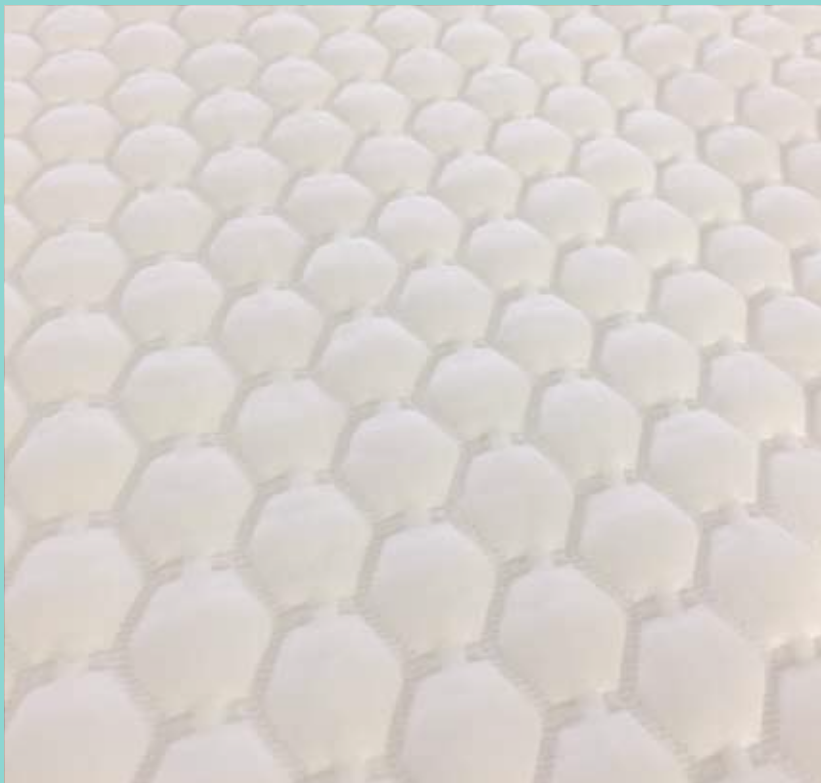
*表面拡大写真。より光沢のある凸面を使用部位にあててお使いください。