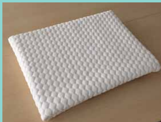
キルティングシートは折りたたんだ状態で包装されています。