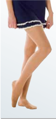
パンティストッキング