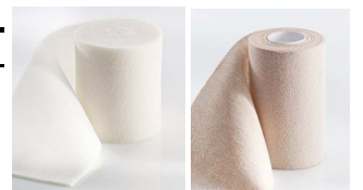
1層目包帯 2層目包帯