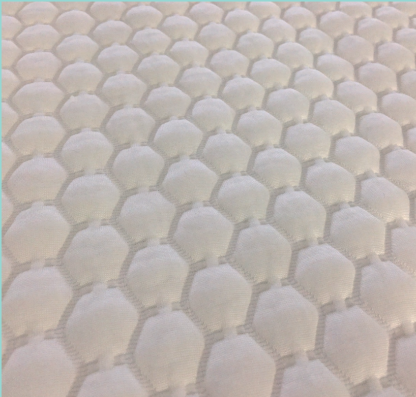
*表面拡大写真。より光沢のある凸面を使用部位にあててお使いください。