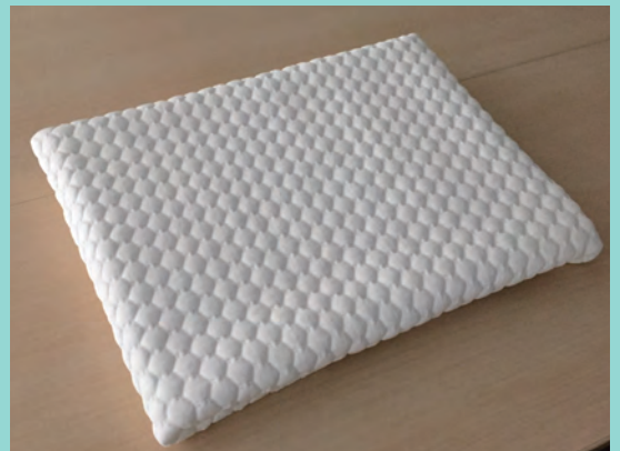
キルティングシートは折りたたんだ状態で包装されています。