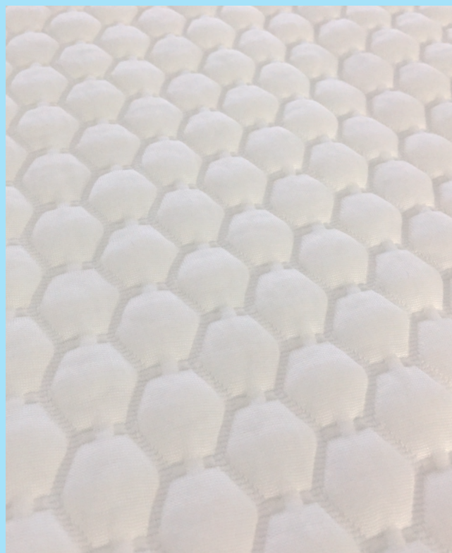
*表面拡大写真。より光沢のある凸面を使用部位にあててお使いください。