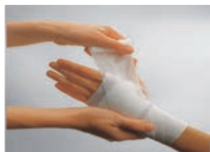
伸縮率 約100% ビスコース56% ポリアミド44%