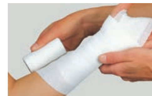
伸縮率 90% コットン 64% ポリアミド 34% ポリウレタン 2%