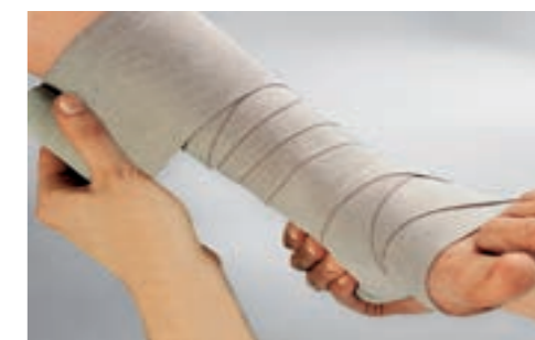
伸縮率 約90% コットン 100%