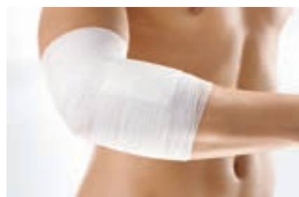
伸縮率 縦:約65% 横:約50% ビスコース66% ポリアミド34%