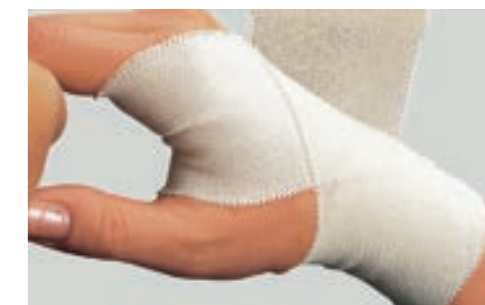
伸縮率 約90% コットン 100%