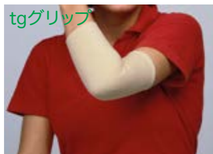
tgグリップ 耐久性と弾力性をそなえたしなやかな筒状包帯 幅は置き寸から最大で約2倍まで伸張

※ メートル販売につきましては、ご注文の際、品番のほかに「メートル数」を必ずご明記ください。伸縮性のある素材のため縮むなどの多少の寸法変化があります。