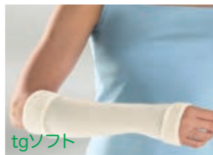
tgソフト 柔らかいコットンを使用 皮膚を保護するタオル地タイプの筒状包帯 幅は置き寸から最大で約4倍まで伸張