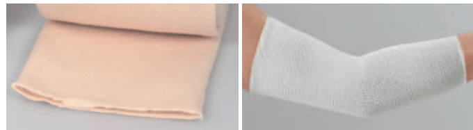
<素材>コットン 85%、エラストジエン(ラテックス)、ナイロン