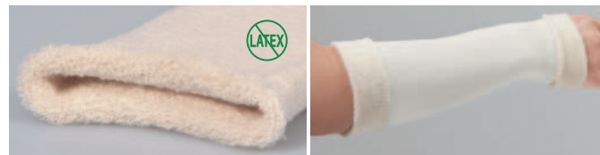
<素材>コットン 85%、ポリウレタン、ナイロン この商品はラテックスフリーです。漂白はしていません。