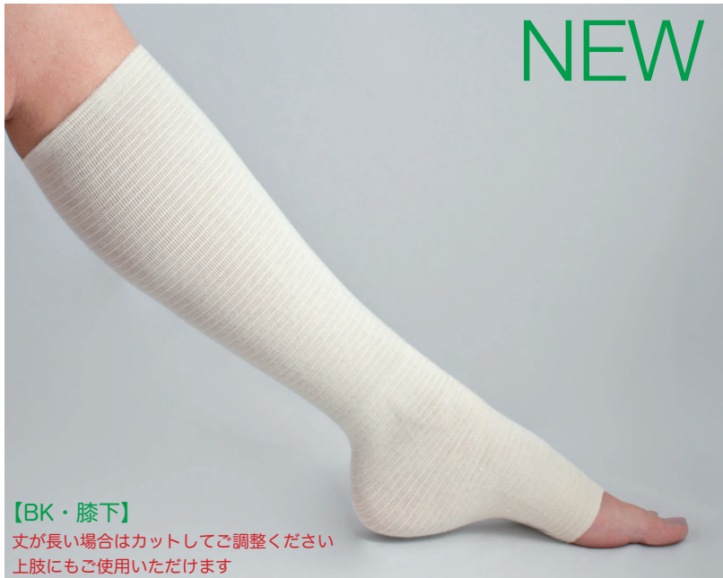
【BK・膝下】 丈が長い場合はカットしてご調整ください 上肢にもご使用いただけます