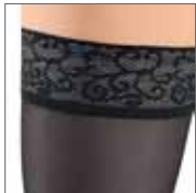
トップバンド付ストッキング