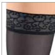
トップバンド付ストッキング