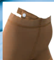
ウエスト調整ベルト付